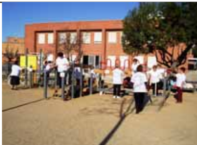
Sessions a l'Espai Lúdic

GRUP 11: Dilluns i dimecres, de 18.00 a 19.00h al gimnàs del CEIP L'Alzina, i divendres, de 9.00 a 9.45 h, 9.45 a 10.30 h i 10.30 a 11.15 h al Poliesportiu.